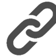
Servicenummers (niet speed, wel...)