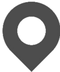
Automatische locatiebepaling melder